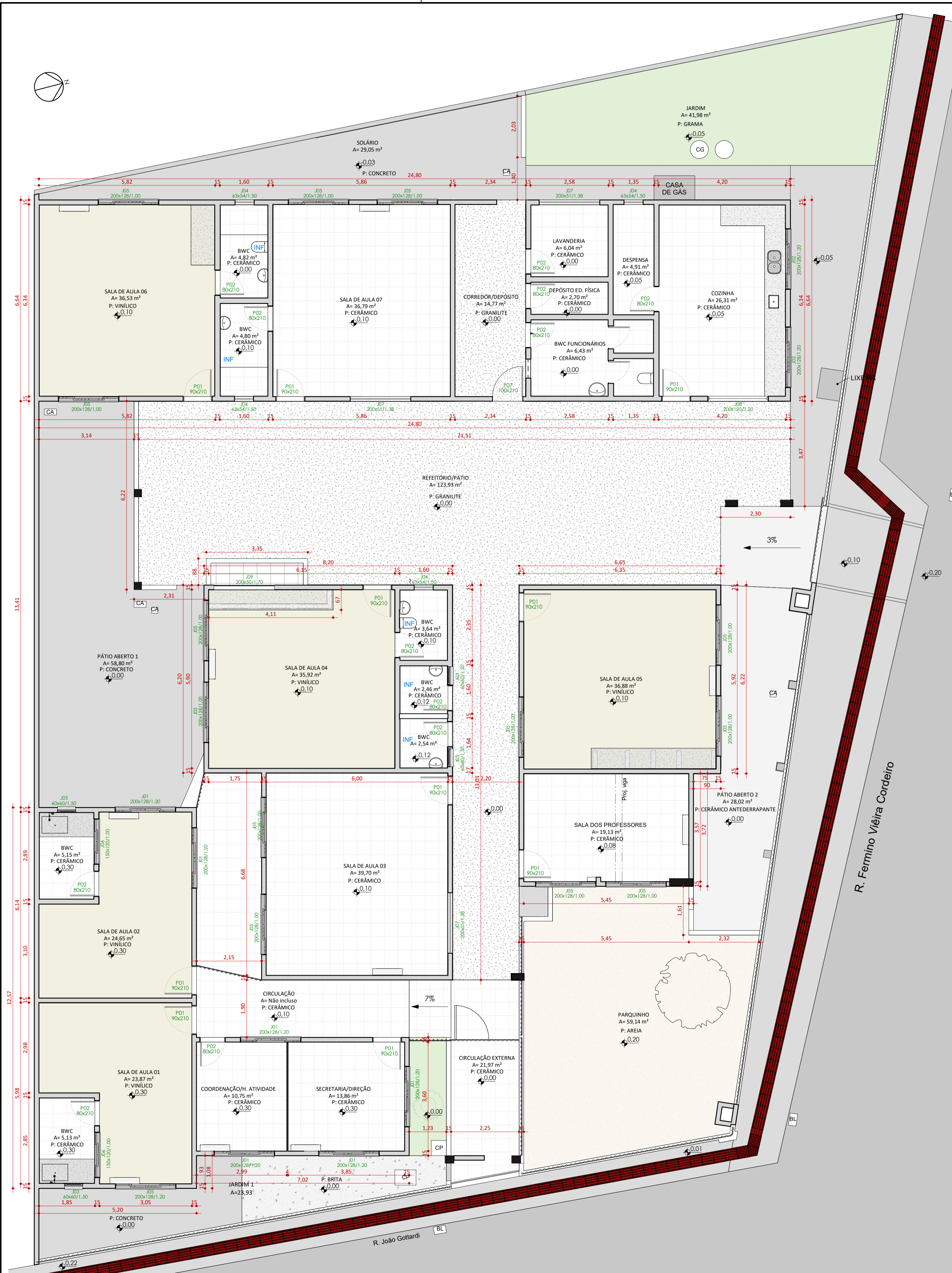
PLANTA BAIXA TÉRREO EXISTENTE ESC:1 : 75